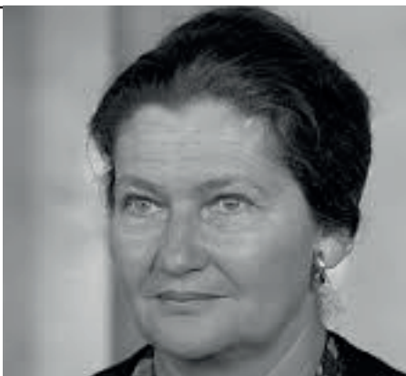
Une femme politique.

C'est une héroïne de la première guerre mondiale. Elle donne des informations secrètes aux Anglais.