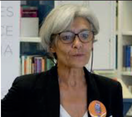
Une spationaute, médecin et scientifique.